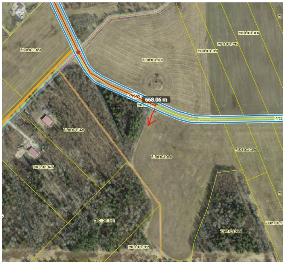
Lisa: Ristumiskoha asukoht maa-ameti kaardil